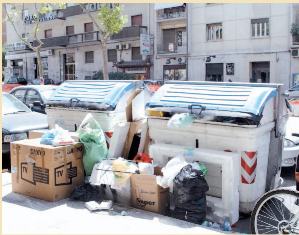
LA VERGOGNA DEI RIFIUTI. Il rifiuto selvaggio non risparmia nemmeno il sindaco, praticamente di fronte alla sua abitazione, in viale Unità d'Italia, un bel cumulo di immondizia ordinatamente depositato tra il marciapiede e i cassonetti

FUOCO | Il caldo concede una piccola tregua