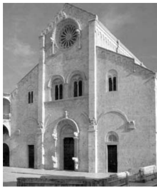
La facciata della Cattedrale di Bitonto