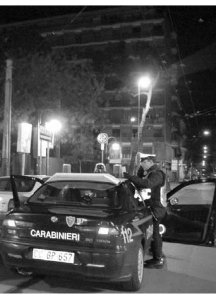
Una maxirissa tra rumeni sedata dai carabinieri a Bitritto. L'episodio è avvenuto nei pressi della Cattedrale dove era in corso un incontro con don Luigi Ciotti

Dai primi riscontri è emerso che il gruppo non era nuovo a questo tipo di sortite litigiose legate anche alla divisione del territorio su cui operare le questue giornalieri.